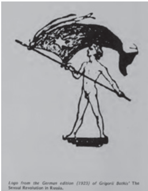
Slika 2. Logo iz njemačkog izdanja Seksualne revolucije u Rusiji Grigorija Batkisa iz 1923. godine; ilustracija iz knjige The Early Homosexual Rights Movement (1864–1935) (Lauritsen & Thorstad, 1974)

Namjera ovog teksta jeste, stoga, da skicira nekoliko ključnih tački istorije homoseksualnosti i kvir marksizma tokom revolucija iz