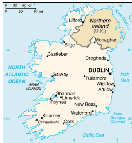
Слика 4. Градови Ирске / Figure 4. Irish cities