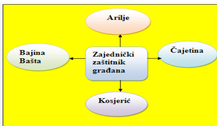
Slika 2. Zajednički zaštitnik građana za više opština (dato kao primer)